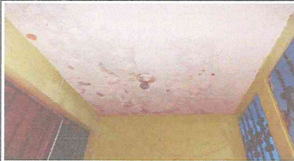
Foto 1: Terraza no cuenta con desnivel para las bajadas de agua pluvial.