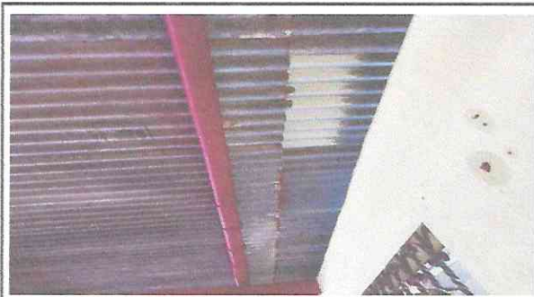
Foto 4: Lamina en mal estado, el tiempo la corrosión en empalmes dejan filtrar el agua a las aulas y pacillos del segundo nivel del establecimiento.