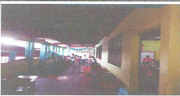
Foto 5: Por el mal estado de la lamina y la corrosion se llueve en el pasillo.