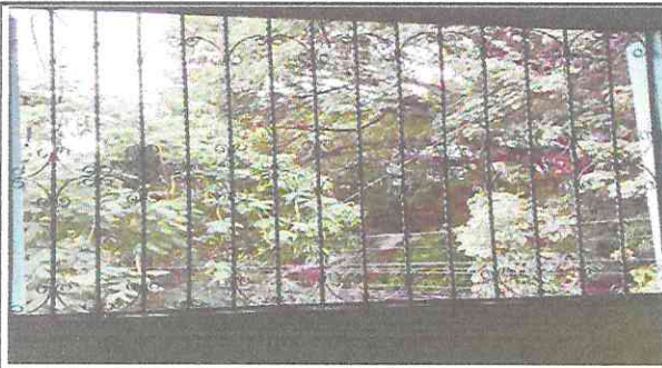
Foto 3: Como se puede observar no cuenta con ventanas y en temporada de lluvias el agua ingresa al pasillo y las aulas.