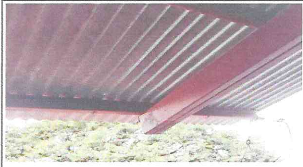
Foto 2: Costaneras en mal estado por problemas de humedad, se necesita mantenimiento para alargar su utilidad.