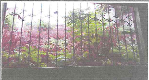
Foto 6: por no haber ventales, en epoca de lluvia ingresa el agua al pasillo y aulas.

Observación: Si es necesario se pueden agregar hojas adicionales indicando el número de hojas.